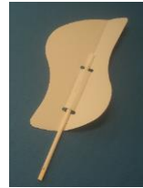
フィン どちらかの形で8本 (TEA-601は フィン4本)