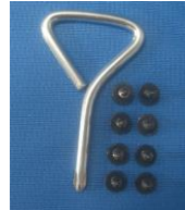
ドライバー 1本 ネジ 8本